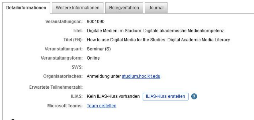
Abbildung 2 Ansicht als Dozent einer Veranstaltung

Als eingetragener Dozent, kann man über die Option „Arbeitsbereich anlegen (ILIAS)“ einen ILIAS-Kursraum zu dieser Veranstaltung generieren.